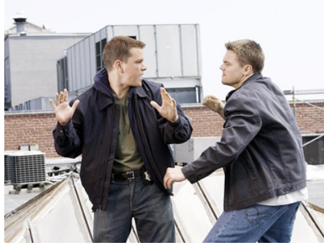
2006 LES INFILTRÉS (The Departed) de Martin Scorsese avec Matt Damon