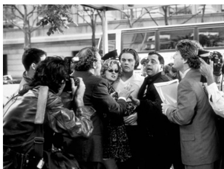
1998 CELEBRITY (Celebrity) de Woody Allen avec Gretchen Mol, Kenneth Branagh