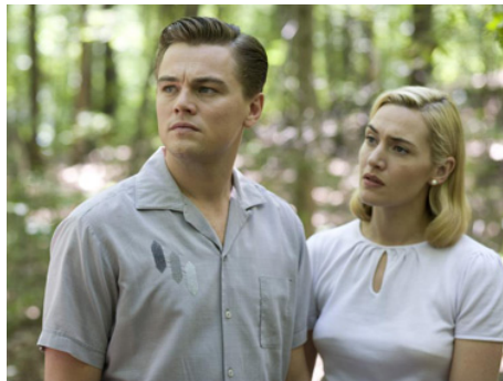
2008 LES NOCES REBELLES (Revolutionary Road) de Sam Mendes avec Kate Winslet