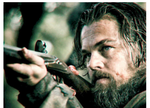
2015 LE REVENANT (The Revenant) d'Alexandro Gonzalez Iñarritu