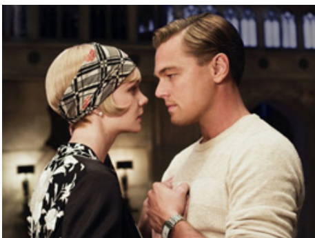
2013 GATSBY LE MAGNIFIQUE (The Great Gatsby) de Baz Luhrmann avec Carey Mulligan