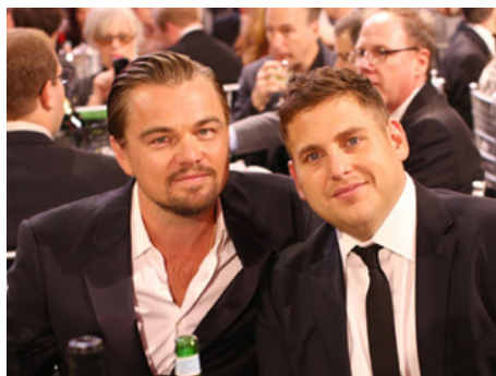
2013 LE LOUP DE WALL STREET (The Wolf of Wall Street) de Martin Scorsese avec Jonah Hill