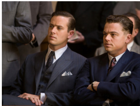
2011 J. EDGAR (J. Edgar) de Clint Eastwood avec Arnie Hammer