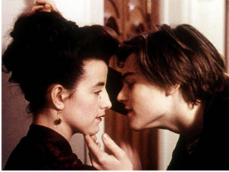
1995 RIMBAUD VERLAINE (Total Eclipse) d'Agnieszka Holland avec Romane Bohringer