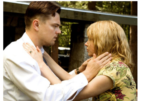
2010 SHUTTER ISLAND (Shutter Island) de Martin Scorsese avec Michelle Williams