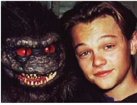
1991 CRITTERS 3 (Critters 3) de Kristine Peterson