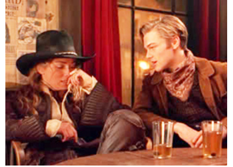
1995 MORT OU VIF (The Quick and the Dead) de Sam Raimi avec Sharon Stone