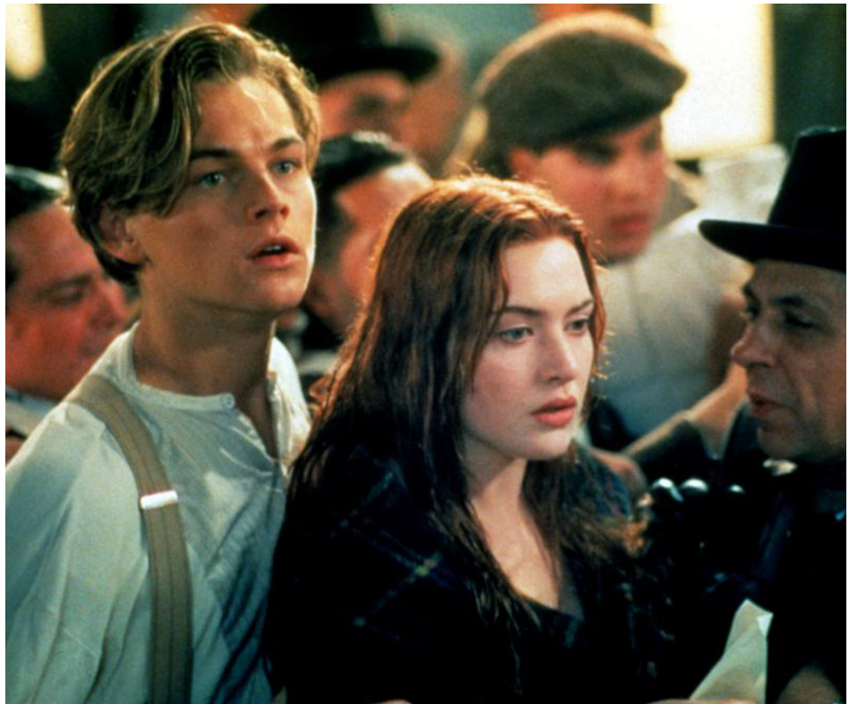
1997 TITANIC (Titanic) de James Cameron avec Kate Winslet