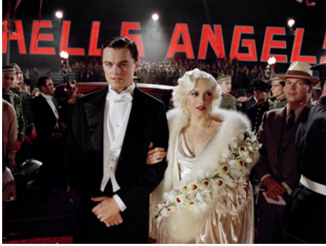
2004 AVIATOR (The Aviator) de Martin Scorsese avec Gwen Stefani