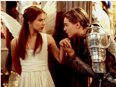
1996 ROMÉO + JULIETTE (William Shakespeare's Romeo and Juliet) de Baz Luhrmann avec Claire Danes