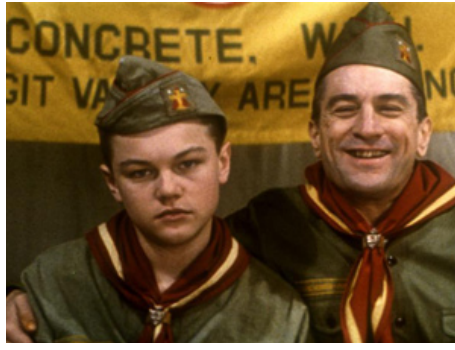
1993 BLESSURES SECRÈTES (This Boy's Life) de Michael Caton-Jones avec Robert De Niro