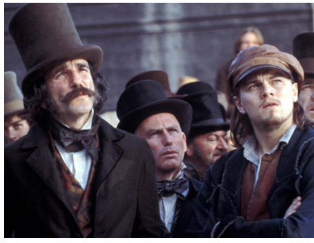
2002 GANGS OF NEW YORK (Gangs of New York) de Martin Scorsese avec Gary Lewis, Daniel Day-Lewis