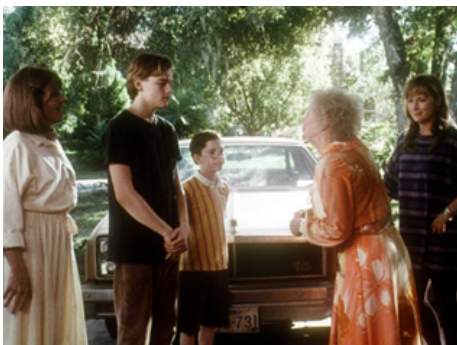
1996 SIMPLES SECRETS (Marvin's Room) de Jerry Zaks avec Diane Keaton, Gwen Verdon, Meryl Streep