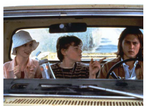
1993 GILBERT GRAPE (What's Eating Gilbert Grape) de Lasse Hallström avec Johnny Depp, Juliette Lewis