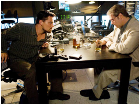
2008 MENSONGES D'ÉTAT (Body of Lies) de Ridley Scott avec Russell Crowe