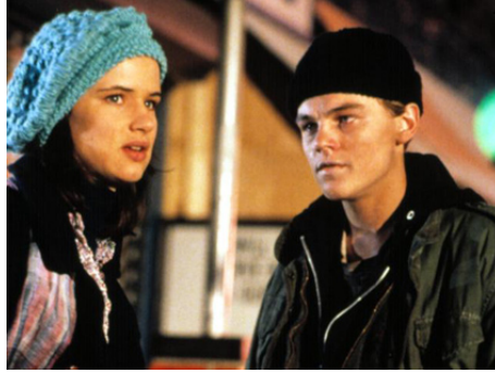
1995 BASKETBALL DIARIES (Basketball Diaries) de Scott Kalvert avec Juliette Lewis