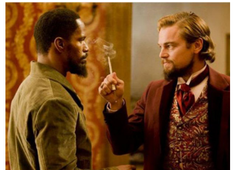
2012 DJANGO UNCHAINED (Django Unchained) de Quentin Tarantino avec Jamie Foxx