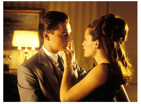
2002 ATTRAPE-MOI SI TU PEUX (Catch me if you can) de Steven Spielberg avec Jennifer Garner